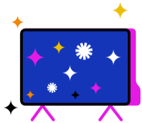
Kostenfreier Zugang zu RTL+