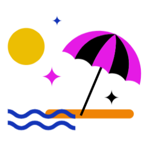
30 + 2 Tage Urlaub