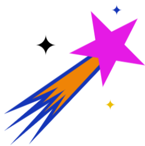
Förderung von Talenten